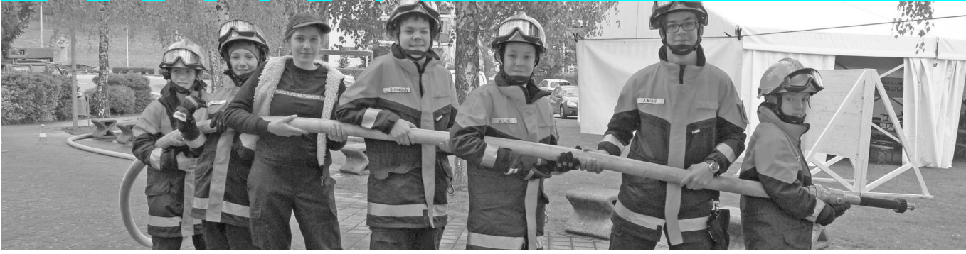
Matran Bouge 2017