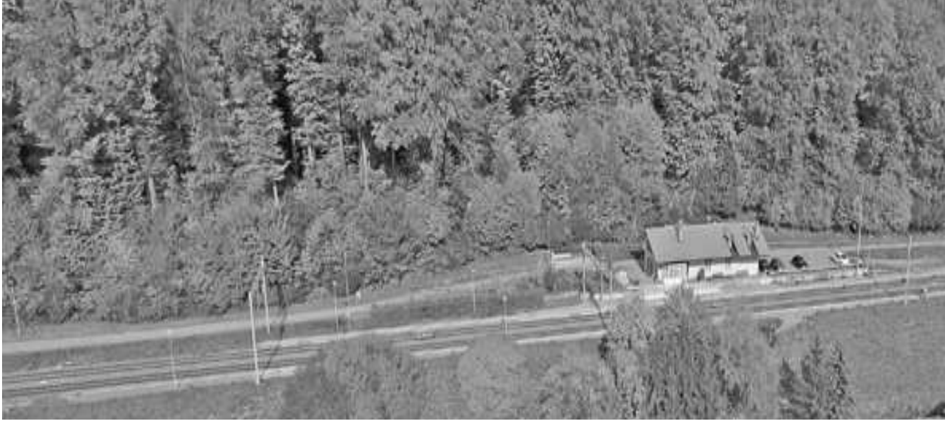
Gare de Matran