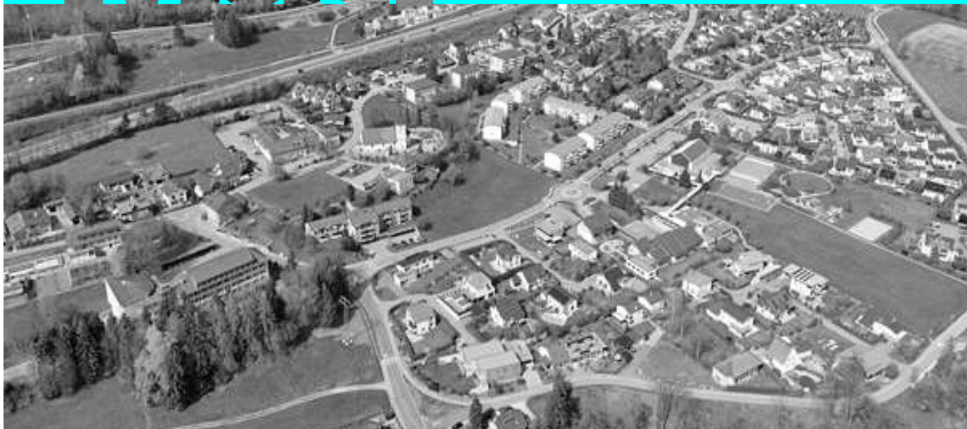
Vue aérienne de Matran