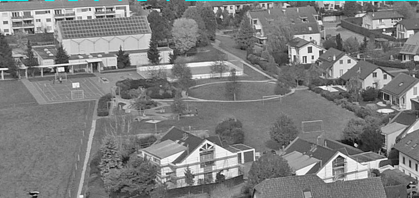
Place de sports et des loisirs actuelle