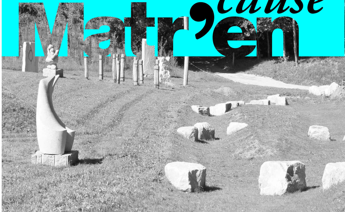
Le nouveau jardin des sculptures