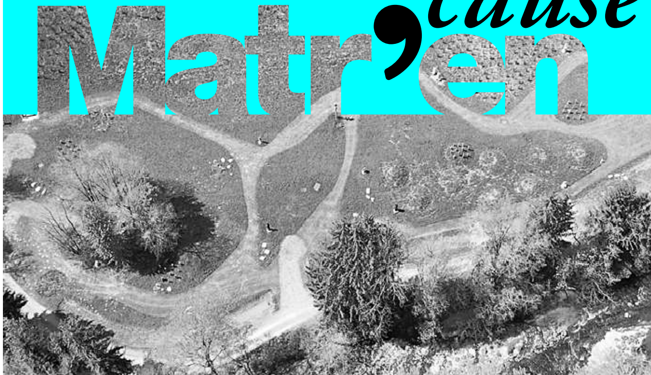
Jardin des sculptures