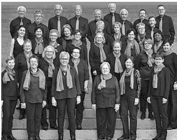
Ensemble "Au Chœur d'Avry-Matran"