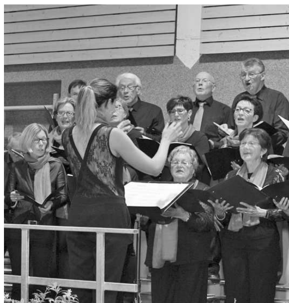
Au Chœur d'Avry-Matran en concert