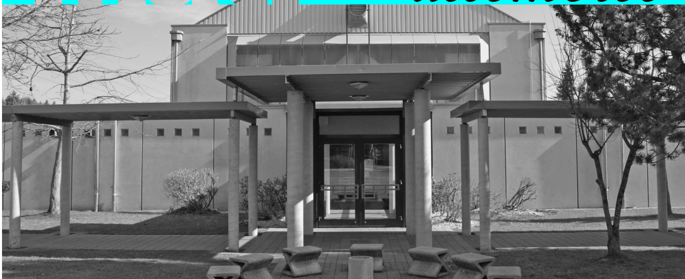
Halle de gym qui nous permettra de respecter les règles sanitaires