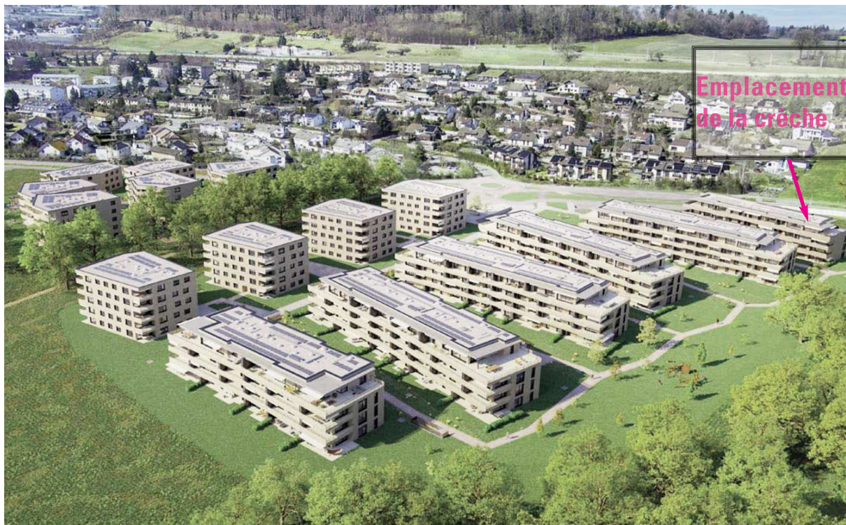
Nouveau quartier de Champ-Riond

Actuellement, il n'existe pas de crèche pour la garde des enfants de 0 à 4 ans sur le territoire communal de Matran.