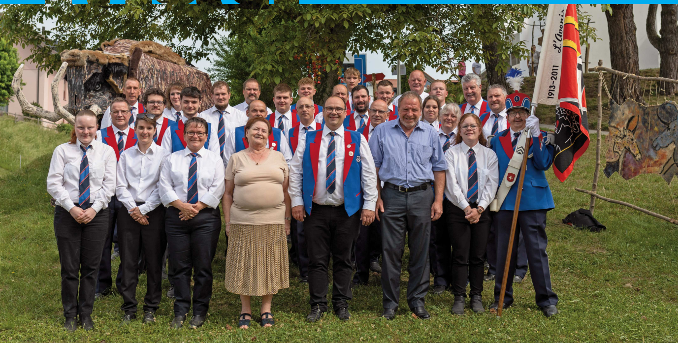
Société de musique L'Avenir d'Avry-Matran