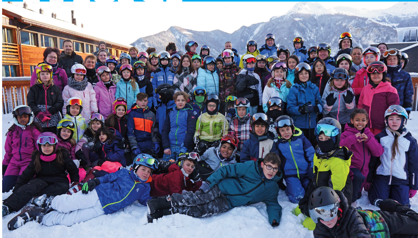
Participants au camp de ski 2023