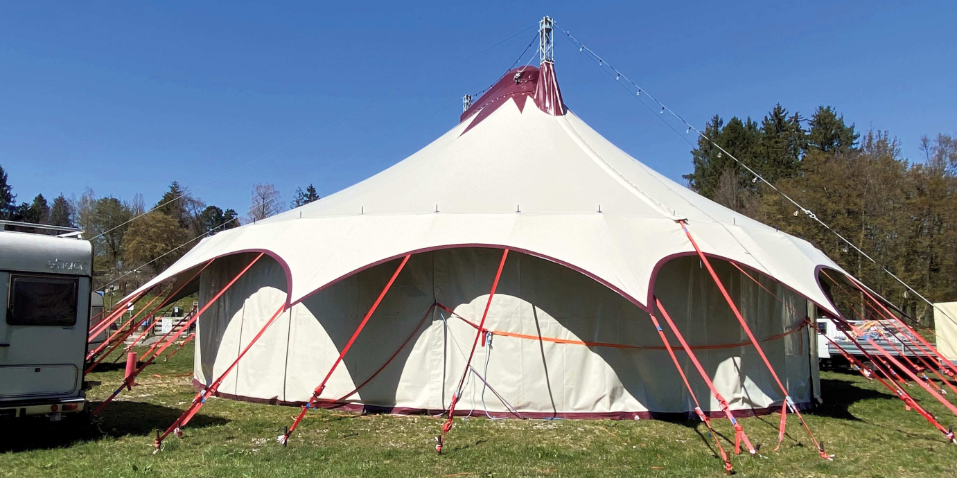
Chapiteau du cirque