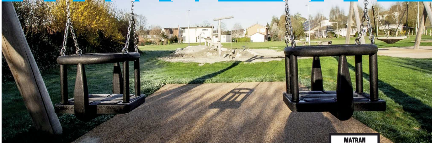
Place de jeux