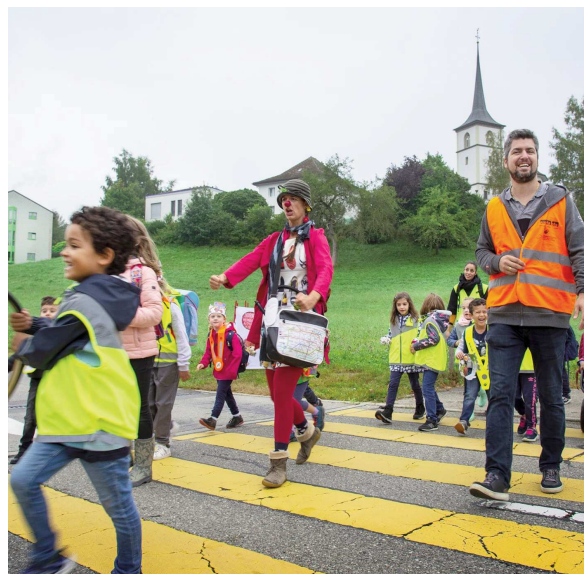
A pied à l'école