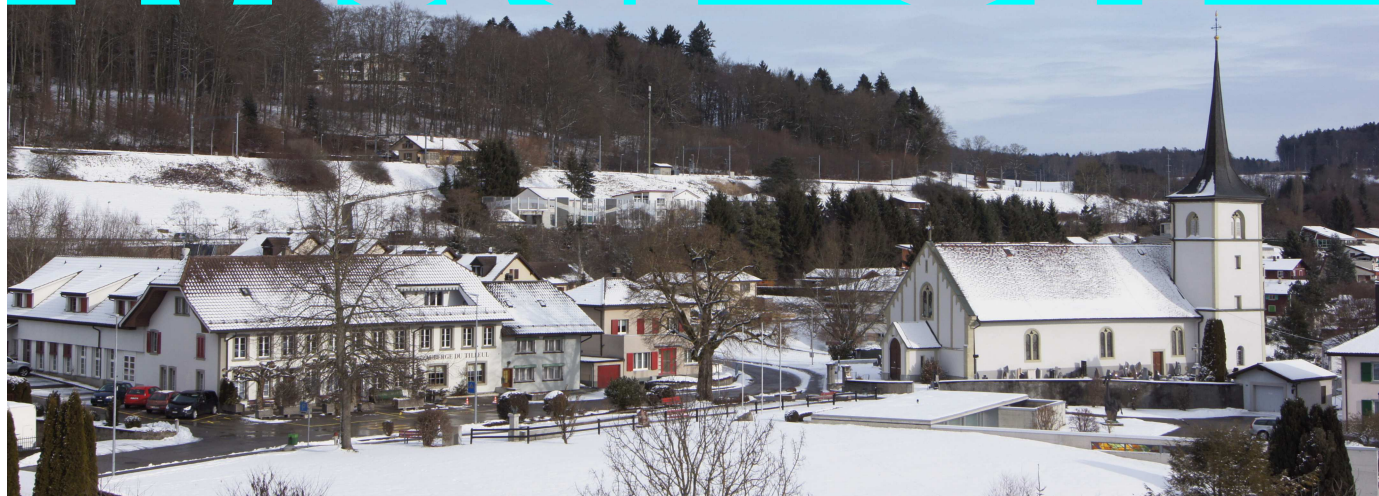
Matran sous la neige