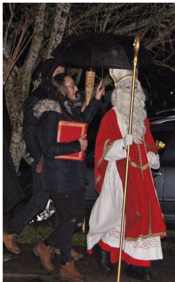
Cortège de la Saint-Nicolas Matran