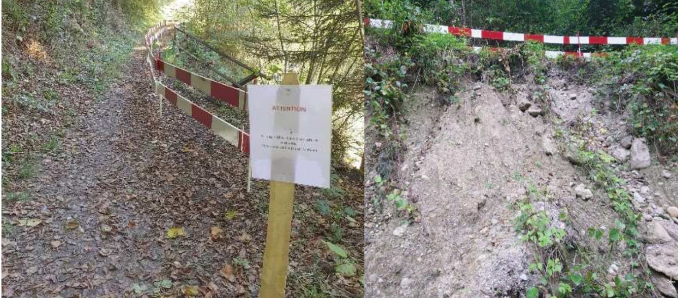
Sentier de la Quiou