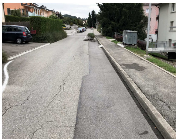
Route de la Maison-Neuve