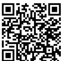
Radiofr, Le mag, « Bilan de l'Action écrans », 01.06.2023